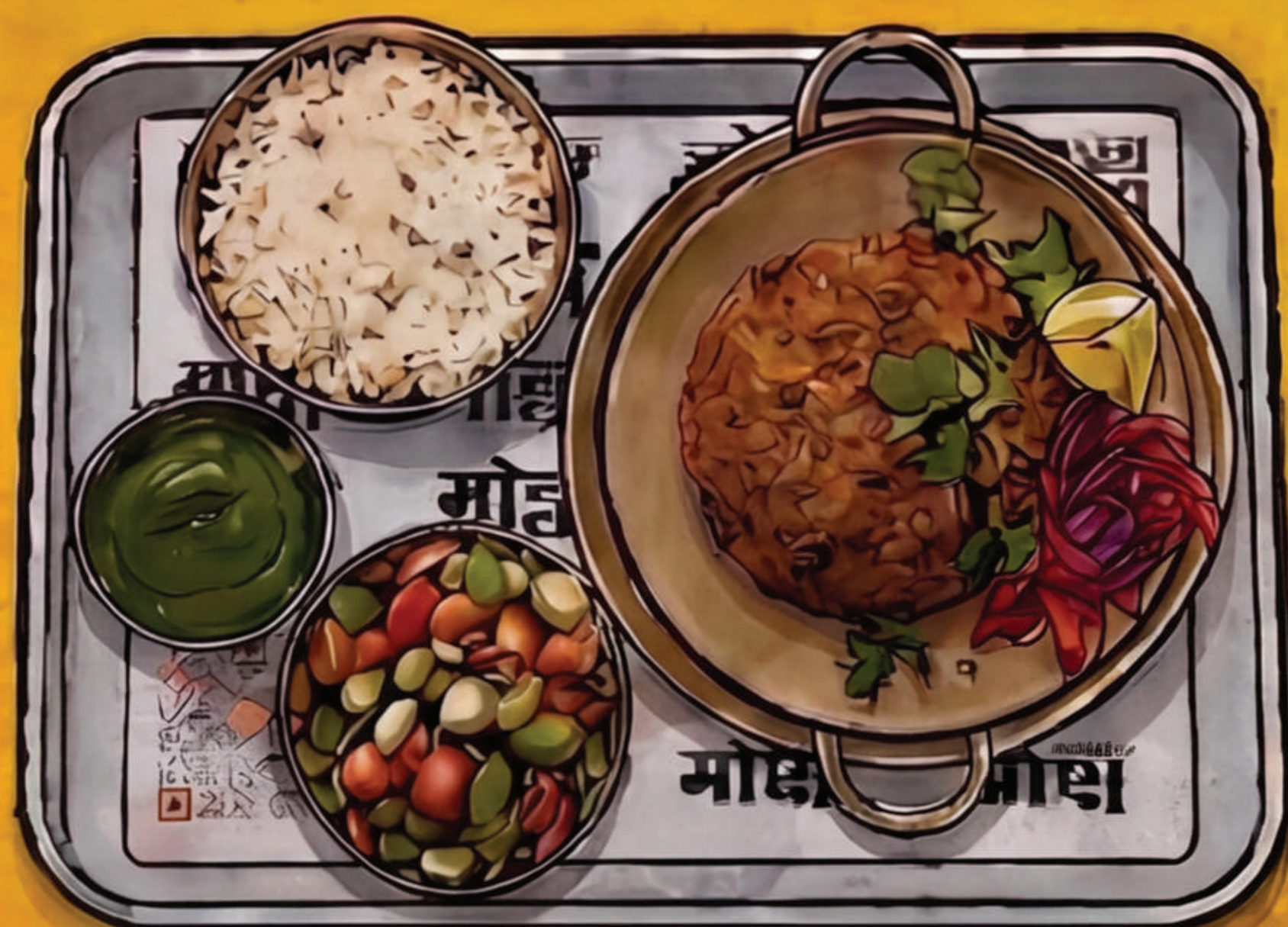
Lamb Keema Combo 1 3 18 00 mit Lammhackfleisch, Reis, Salat & Chutney, halal.