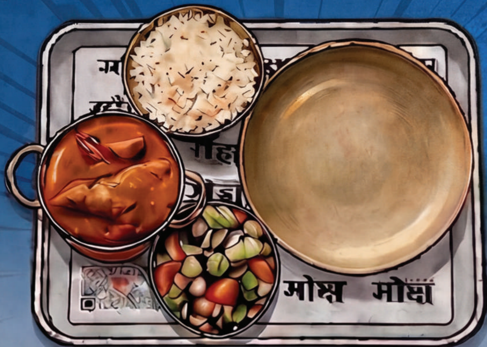
Butter Chicken Combo 1 2 14 00 mit Curry, Reis & Salat, halal.