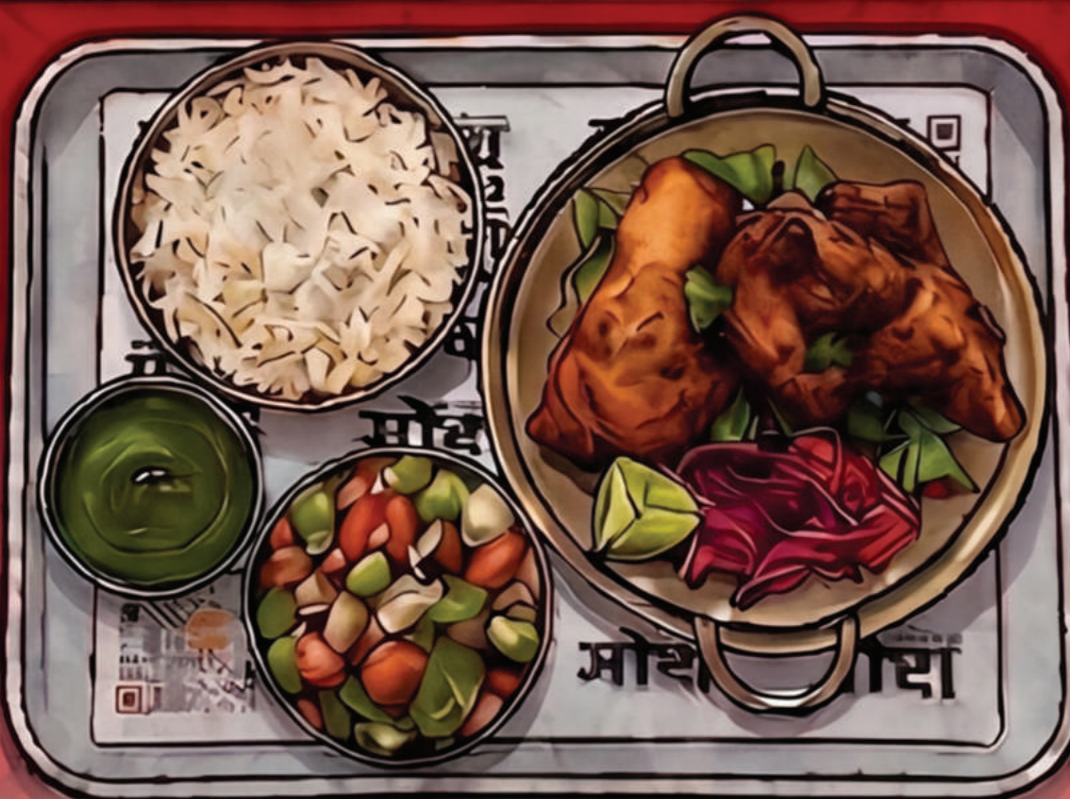
Tandoori Chicken Combo 1 17 00 mit Hähnchen, Reis, Salat & Chutney, halal.